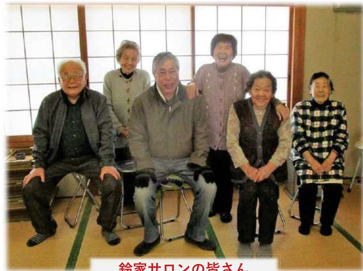
鈴家サロンの皆さん