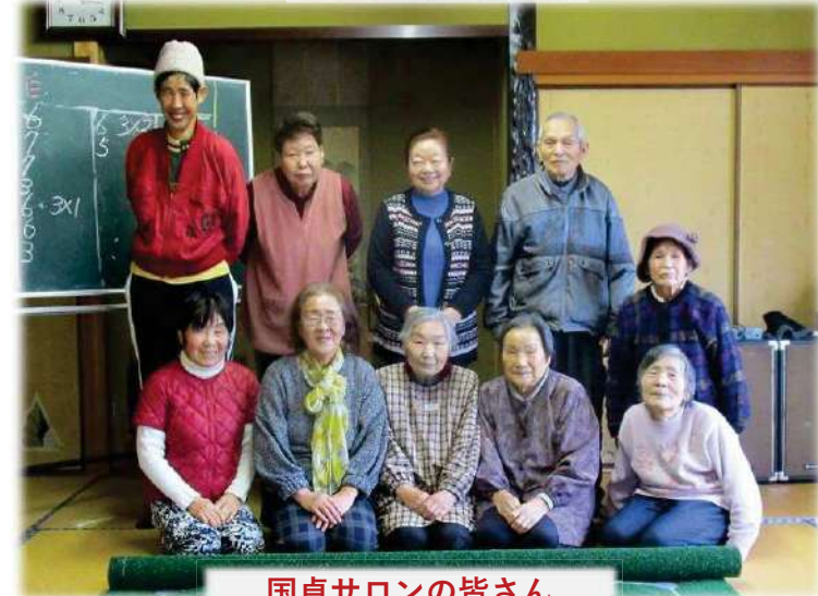
国貞サロンの皆さん