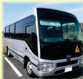
新しいスクールバス

福山小学校と土居小学校が統合された時に生れ、20年間、延べ30万Kmを走り続け、多くの子ども達の通学の足となってくれた初代スクールバスが、その役割を終え、二人の香山運転手によって2代目へ引き継がれました。ありがとうございました。